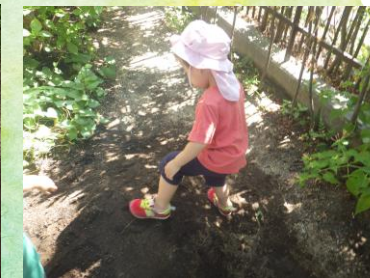
「スケボー」 立ってすべってみよう