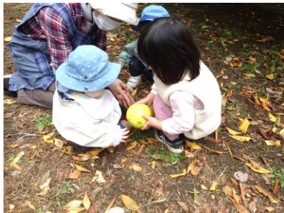
中庭で採ったジャンボレモン 「さわってみる？」