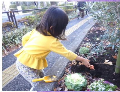
「おはなのとなり、うえたいな」