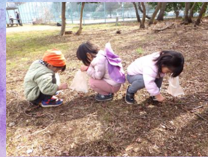
お散歩先の広場で柿の種拾い