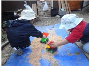
おが粉の上を走らせる感触