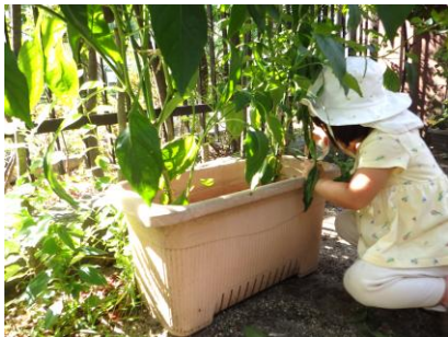
「おおきくなーれ」 根元に水をあげて