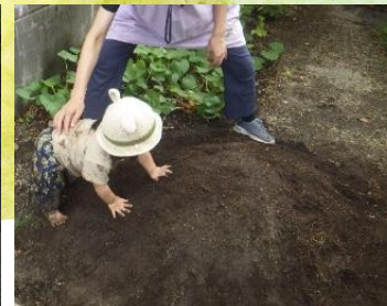
「やってみたいな」 1歳の人を見て、ハイハイで 登ってみる0歳児