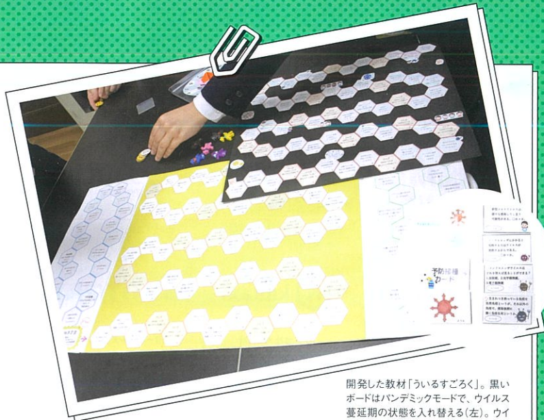
開発した教材「ういるすごろく」。黒いボードはパンデミックモードで、ウイルス蔓延期の状態を入れ替える(左)。ウイルスカード、予防接種カード、クイズカードなどが付属する(右)。

「検温を日課にする。6HP(ヘルスポイント)もらう」 「定期的な部屋の換気を怠る。5HP失う」。お茶の水女子大学附属高等学校のチームおちゃふあいぶの5人が開発したボードゲーム「ういるすごろく」のコマだ。今後このゲームをたくさんの子どもに遊んでもらい、遊びながらウイルスと免疫について学んで欲しいと考えている。